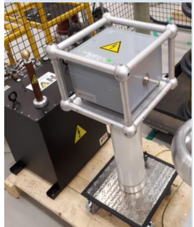
ABB - LABORATORIO DE DESCARGAS PARCIALES EN RECONECTADORES (IEC3760-2012)