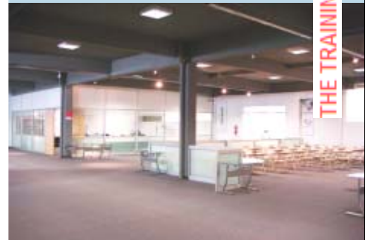
THE TRAINING SESSIONS

A la vez de contar con salones equipados para disertantes y eventos protocolares, posibilita al mismo tiempo realizar demostraciones de usos de sus productos, en un ambiente tecnológico de primer nivel, orientando la capacitación eficiente a potenciales clientes y público en general.